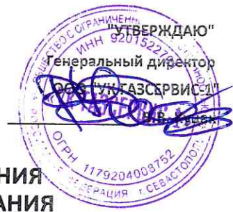
ГРАФИК ПРОВЕДЕНИЯ ТЕХНИЧЕСКОГО ОБСЛУЖИВАНИЯ ВНУТРИКВАРТИРНОГО ГАЗОВОГО ОБОРУДОВАНИЯ (ТО ВКГО) АВГУСТ 2023г.